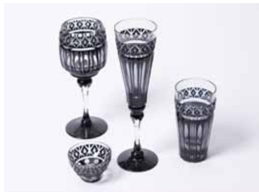
【鹿児島県商工会連合会】