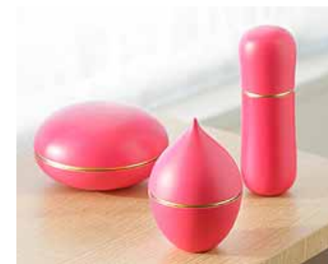
【会津若松商工会議所】