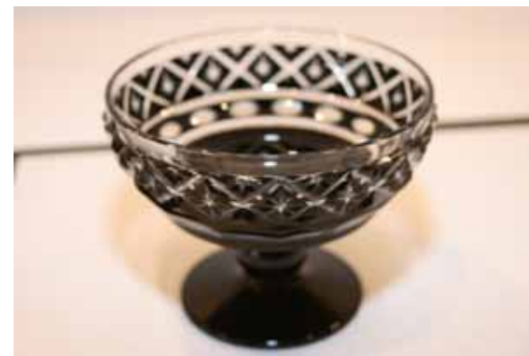
【鹿児島県商工会連合会】