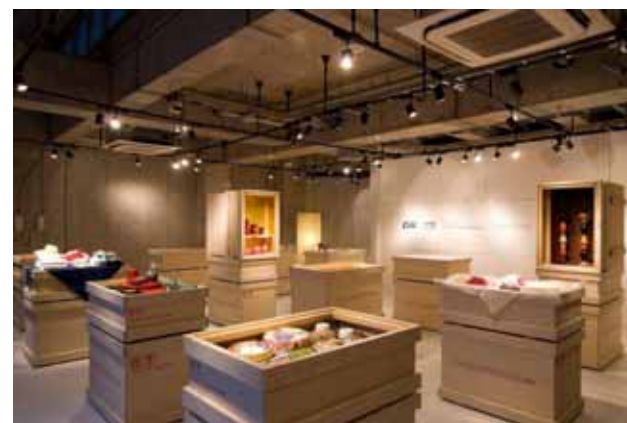
青木 淳氏会場構成による「Rin」における「TOUCH! JAPAN BRAND展」(2008.10.30 ~ 11.3)の様相